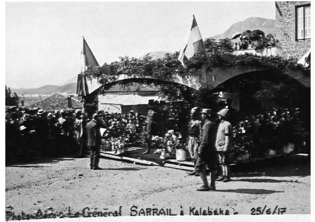
Ο στρατηγός Μ. Sarrail στην Καλαμπάκα, στις 25/06/1917.

Ιδιαίτερα τεταμένη ήταν η κατάσταση στην περιοχή της Καλαμπάκας. Οι οργανωμένες από τους μοναρχικούς ανταρτικές ομάδες, οι οποίες δρούσαν την εποχή του Διχασμού στην ουδέτερη ζώνη μεταξύ Τρικάλων και Γρεβενών, είχαν τώρα μετατραπεί σε ληστοσυμμορίες και λεηλατούσαν τα ορεινά χωριά. Όμως, εκτός από τους « οργιαστές », όπως αποκαλούσαν οι βενιζελικοί τους συμμετέχοντες στα μοναρχικά σώματα, είχαν καταφύγει στα ορεινά χωριά και πολλοί Τρικαλινοί αντιφρονούντες, οι οποίοι την εποχή της παντοδυναμίας των επιστράτων προκαλούσαν τους φιλελευθέρους με τη φράση « Μολών λαβέ ». Αυτοί, ύστερα από μικρό χρονικό διάστημα, επέστρεψαν στην πόλη και έκαναν ξανά την εμφάνισή τους στην πλατεία Ρήγα Φεραίου, επιλέγοντας ως μέσο αντίστασης να μην παίρνουν ρέστα σε γαλλικά φράγκα και να μη σηκώνονται όρθιοι την ώρα που οι Γάλλοι