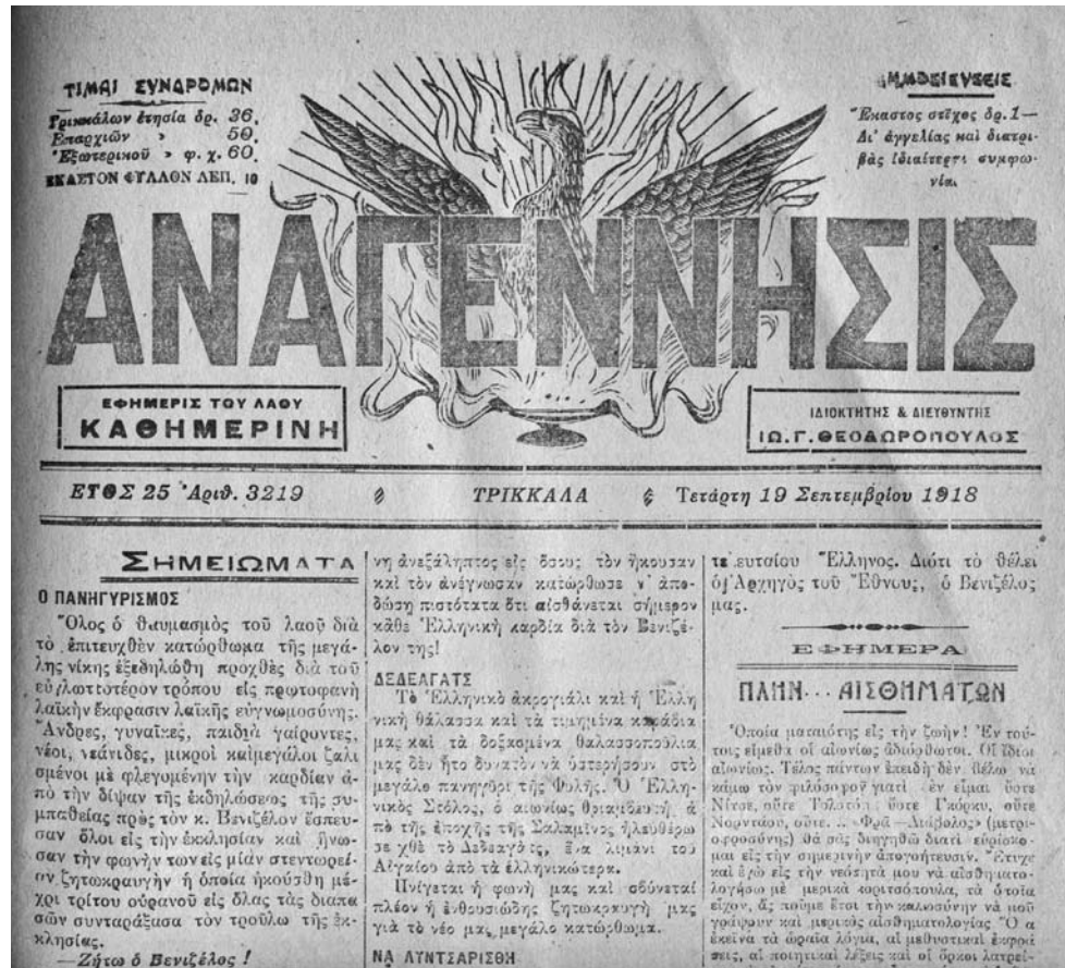
Η εφημερίδα Αναγέννησις Τρικάλων.

μένου να δημιουργήσει κλίμα εμπιστοσύνης, προσπάθησε να δείξει επιείκεια στους πολιτικούς της αντιπάλους, αποφεύγοντας τις ακρότητες. Όμως, η έλλειψη πυγμής ενδάρρυνε τους Τρικαλινούς μοναρχικούς, οι οποίοι, συνεχίζοντας την τακτική της προπαγάνδας, διέδιδαν νίκες του γερμανικού στρατού. Έφτασαν μάλιστα στο σημείο να τοιχοκολλούν και να γράφουν στα τραπεζάκια των καφενείων «να αναμένη με υπομονή ο λαός την κάθοδο των Γερμανών και την επάνοδο του βασιλέα». 26