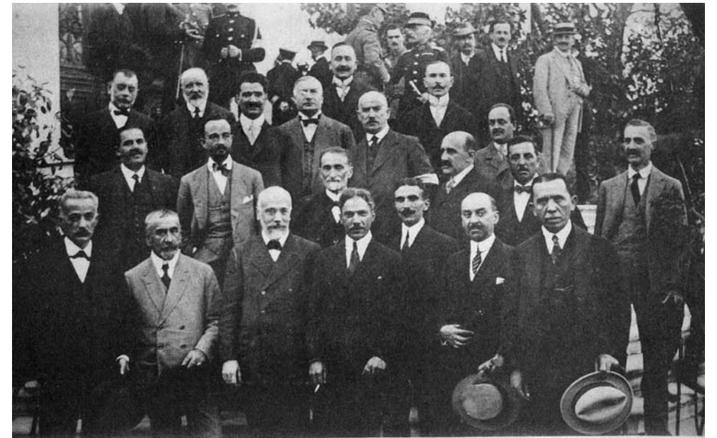
«Οι πρωτεργάται της επανάστασης εν Θεσσαλονίκη», ταχυδρομική κάρτα.

Τη Δευτέρα 12 Ιουνίου - 25 Ιουνίου, τα Τρίκαλα υποδέχθηκαν τον στρατηγό Sarrail, διοικητή της Στρατιάς της Ανατολής. Το δημοτικό συμβούλιο, για να τον τιμήσει, έσπευσε να μετονομάσει την οδό Λαρίσης σε «οδό στρατηγού Sarrail». Η υποδοχή που επεφύλαξαν οι Τρικαλινοί στον στρατηγό ήταν αποθεωτική. Παρά τη ζέστη, πλήθη κόσμου ήταν στριμωγμένα κατά μήκος της οδού Ασκληπιού. Κα-